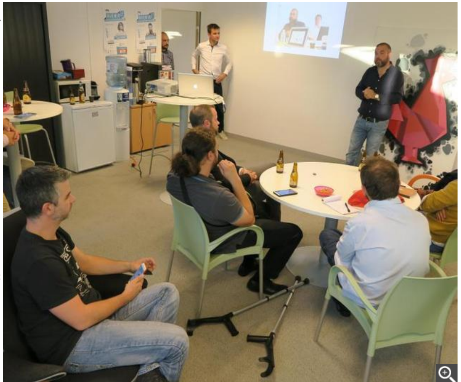
Chacun a présenté le projet pour lequel il a été sélectionné.

Lancé en 2014, Start Innov propose un accompagnement de trois mois aux porteurs de projets dans le domaine du numérique. Trente-huit dossiers ont été déposés et sept ont été retenus par le jury : trois dans la Vienne, deux dans les Deux-Sèvres, un en Charente et un en Charente-Maritime. Outre le projet Millésime, l'assistant de cave à vins déjà évoqué, un projet ambitieux de partir sur « les traces de vos héros » de films, livres, musique dans le monde entier ; une application compte mettre en rapport cueilleurs de fruits et entrepreneurs ; un site espère permettre de faire ses courses en ligne de manière éthique ; un guide des chemins, des jeux éducatifs, une application de prises de commandes par les clients dans les restaurants complète la sélection.